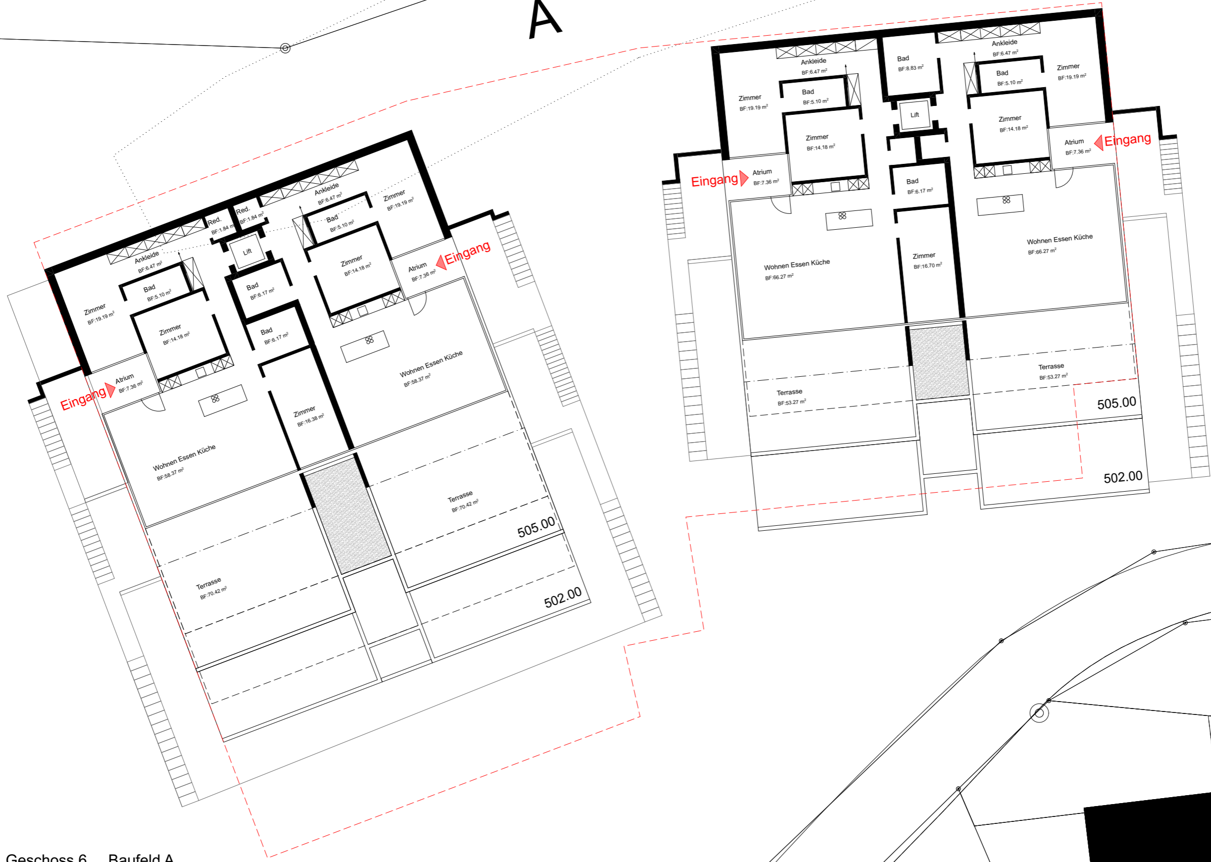
Grundriss 1/200 Geschoss 6 Baufeld A

ETW am Wernlihang Froburgstrasse, 4632 Trimbach